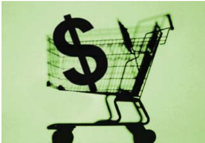
LAS ESTAFAS DE “COMPRADOR SECRETO” O “MYSTERY SHOPPER”

• Cuidado con las compañías que le piden que utilice dinero de su propio bolsillo para las compras secretas.