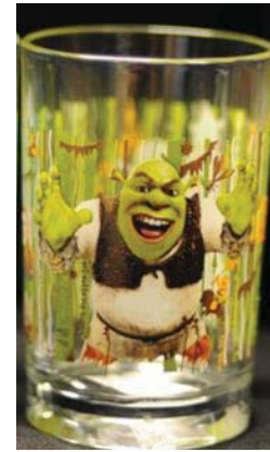
RETIROS DE PRODUCTOS

La CPSC, en colaboración con Sprout Stuff, de Austin, Texas, anunció el retiro de alrededor de 40 "Ring Slings." La CPSC recomienda a los consumidores dejar de utilizarlo inmediatamente debido a un riesgo de asfixia para los bebés. La CPSC y Sprout Stuff tienen conocimiento de una muerte de un bebé de 10 días de edad causada por el uso de "Ring Sling" en Round Rock, Texas en 2007. El esling de Spout Stuff es hecho con tela de muselina natural y viene con o sin hombreras. El cabestrillo es usado por los padres y cuidadores para cargar a un niño de hasta dos años de edad. "Sprout Stuff" está impreso en la parte trasera del dobladillo de la cola. Sprout Stuff vendió estos cabestrillos de bebé retirados, que se fabricaron en los Estados Unidos, directamente a los consumidores entre Octubre de 2006 y Mayo de 2007 por alrededor de $35.00 y $45.00. Spout Stuff está poniéndose en contacto con los compradores conocidos de estos slings de bebé retirados. Los consumidores deben dejar de usar el producto y ponerse en contacto con Sprout Stuff para devolver el cabestrillo por un reembolso completo. No trate de arreglar este producto. Llame a Sprout Stuff al número gratuito (877) 319-3103 en cualquier momento, por correo electrónico de la empresa al sproutstuffrefunds@gmail.com o póngase en contacto con la empresa por correo postal a Sprout Stuff Refunds, P.O. Box 612, Buda, Texas 78610.