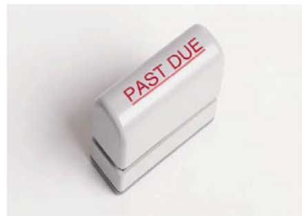
PROMETEN ELIMINAR SUS DEUDAS Y BORRAR SU MAL CREDITO

Tenga cuidado - declaraciones como, "Problemas de crédito? No hay problema", "Podemos eliminar las bancarrotas, juicios, embargos preventivos, y los préstamos incobrables de su informe de crédito para siempre", "Podemos borrar el mal crédito garantizado al 100%", o "Crear una nueva identidad de crédito legalmente" - son alarmas de que la agencia de consejería de crédito no es legítima. Nadie puede quitar la información precisa negativa de un informe de crédito. Además, usted mismo puede hacer todos los tramites que una agencia de consejería de crédito puede realizar legalmente, sin costo alguno. ●