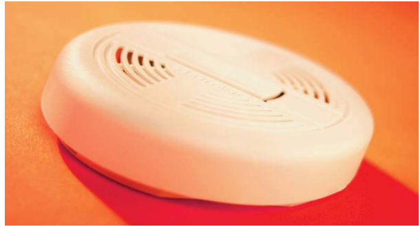
PROTÉJASE DE UNA INTOXICACIÓN POR MONÓXIDO DE CARBONO

• Nunca prenda un coche en un garaje cerrado, y no haga funcionar un automóvil en un garaje incluso si la puerta del garaje está abierta. Los vapores pueden acumularse rápidamente y se filtran en el interior