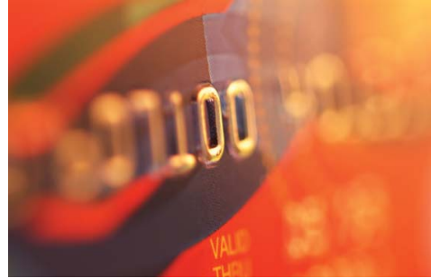
CRÉDITO O DÉBITO: ¿NO SON LO MISMO?

No todo los plasticos son iguales, advierte la Presidenta y Directora Ejecutiva de la Junta de Protección al Consumidor del Estado de Nueva York (CPB) Mindy A. Bockstein. “A pesar de que es posible que todas tengan el mismo aspecto y puedan utilizarse para pagar artículos, las tarjetas de crédito y de débito no son iguales y tienen diferentes protecciones para los consumidores dependiendo de cada producto. Por lo tanto, los consumidores deben tomar nota de las diferencias.”