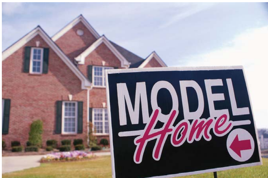
NO CAIGA EN LA ESTAFAS DE MODIFICACIÓN DE PRÉSTAMOS HIPOTECARIOS

Debido a la cantidad de personas que están pasando por dificultades para pagar sus hipotecas y que enfrentan la posibilidad de una ejecución hipotecaria, los anuncios de empresas de modificación de préstamos están hasta en la sopa. Las propagandas aparecen en televisión, por la radio, por teléfono, en la computadora, en el periódico y peor aun de puerta en puerta. El anuncio es el mismo en todos los casos: "évitela ejecución." "Baje su pagos mensuales de hipoteca." "La manera rápida y fácil para salvar su casa." "100% de éxito." Sin embargo, no todo lo que brilla es oro. La Junta de Protección (CPB) y otras entidades les advierte que muchos de estos negociantes son estafadores y les aconseja a los propietarios a tener mucha cautela.