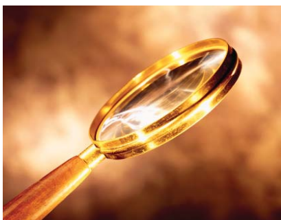
LAS ESTAFAS MAS POPULARES CONTRA LOS LATINOS

hotel gratis en Miami, República Dominicana o Puerto Rico o usted recibió una carta que le informa de sus ganancias. El estafador convence a los consumidores a creer que han ganado un paquete de vacaciones con todo incluido. Para asegurar sus ganancias, el estafador dice que el consumidor debe dar su número de tarjeta de crédito y pagar cientos